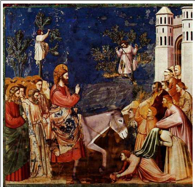
Freskengemälde von Giotto di Bondone in der Cappella degli Scrovegni in Padua